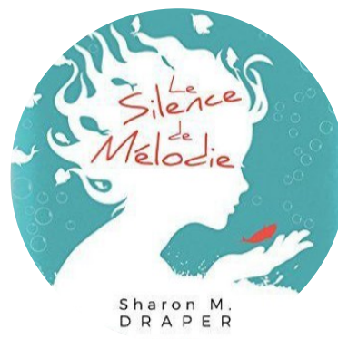
Le silence de Mélodie Sharon M. Draper