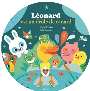
Léonard est un drôle de canard Yann Walcker Julie Mercier