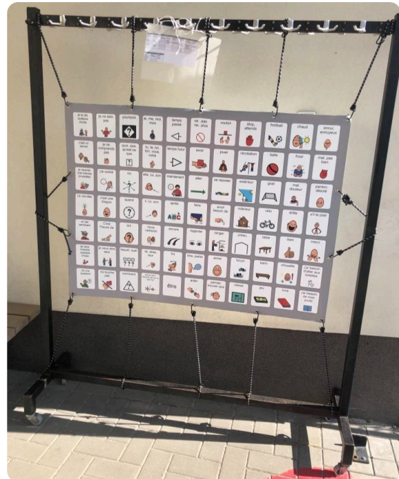
École secondaire d'enseignement spécialisé de l'Escalpede