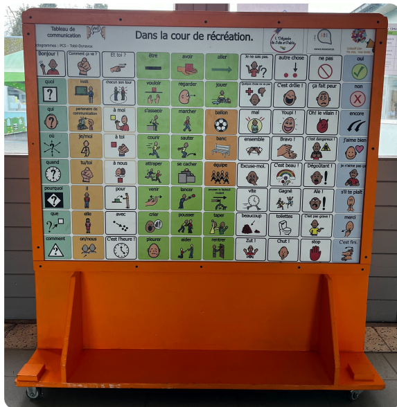
École fondamentale d'enseignement spécialisé maternel et primaire de Saive