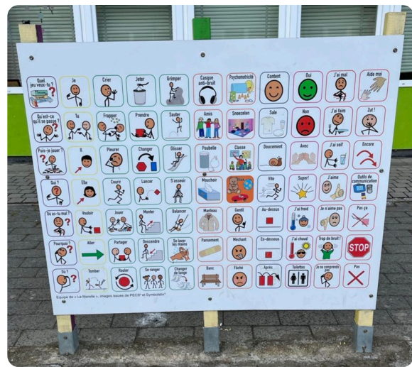
École maternelle et primaire d'enseignement spécialisé La Marelle