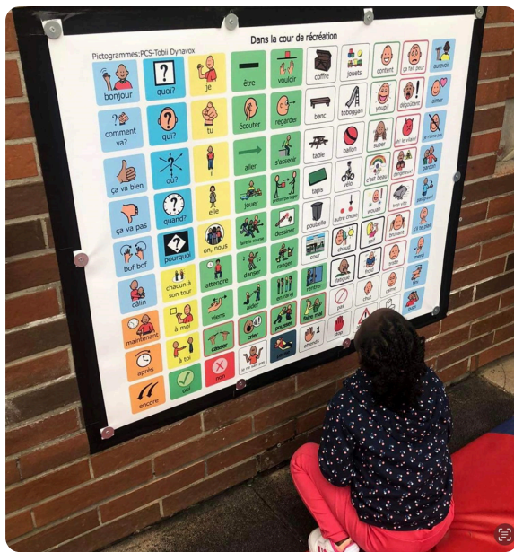
École fondamentale d'enseignement spécialisé maternel et primaire Les Castors