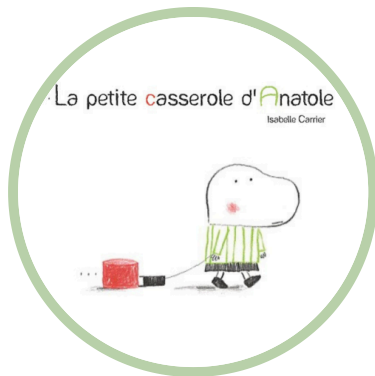
La petite casserole d'Anatole Isabelle Carrier